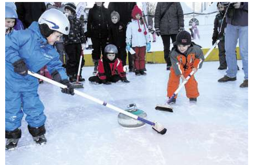
«Besentanz»: Das Spiel mit Curlingsteinen bereitet auch den Kleinen Riesenspass.