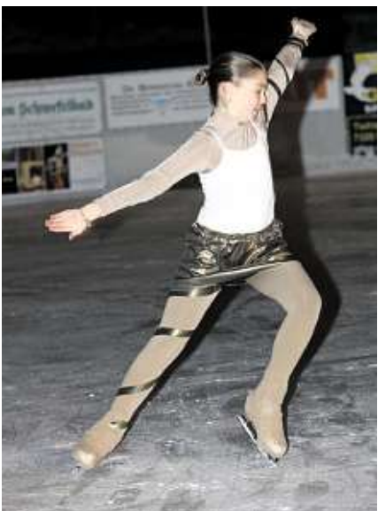
Grazie und Perfektion: Leidenschaftliche Eiskunstlauf-Vorfürungen begeisterten das Publikum.