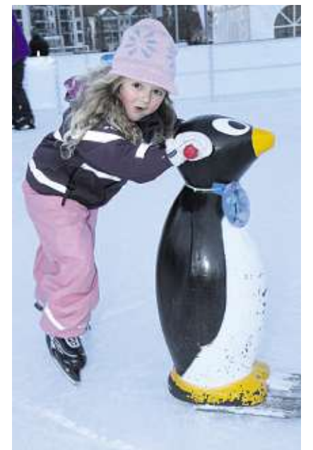
Sicher ist sicher: «Pingu» ist eine gute Stütze.