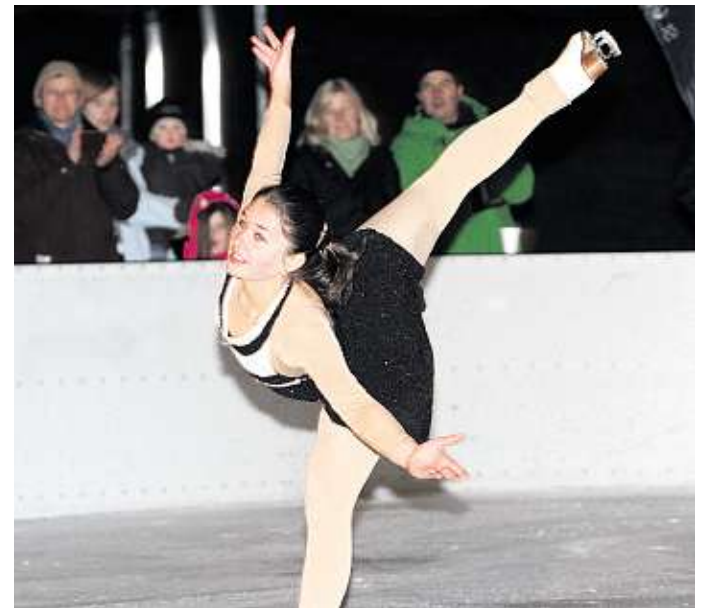
Standing Ovationen fürs «Iis-Fäscht 2012»: Erst dürfen die Besucher selber aufs Glatteis – dann werden sie bei der RSA in Sargans in eine Welt voller Emotionen entführt.